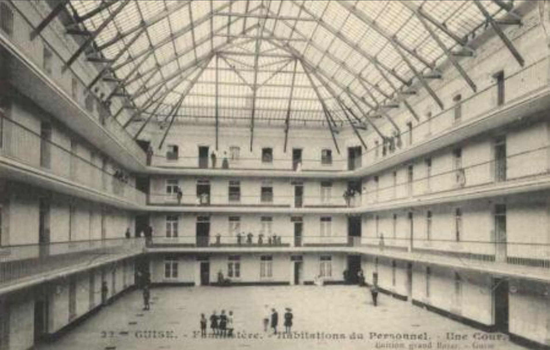
22. - GUISEL. - Familistère. - Habitations du Personnel. - Une Cour. Union grand Bazar. - Guise

L'innovation systématique requiert la volonté de considérer le changement comme une opportunité.